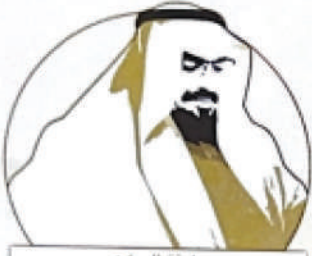
مسابقة الدكتور عبدالرحمن العبدالله المشيقح الأدبية