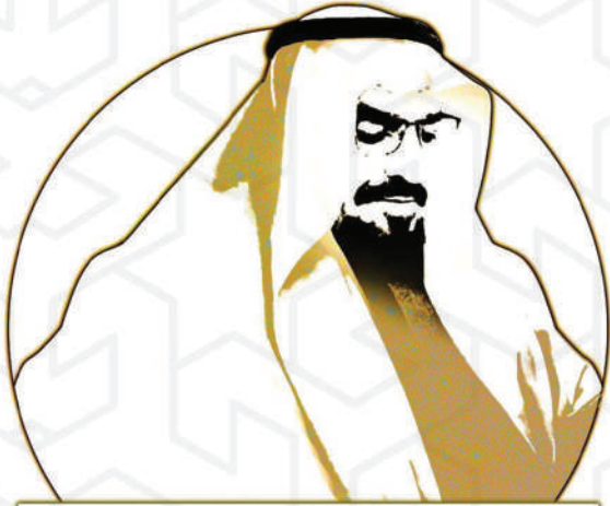
مسابقة الدكتور عبدالرحمن العبدالله المشيخ الأدبية