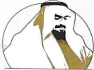
مسابقة الدكتور عبدالرحمن العبدالله المشيقح الأدبية