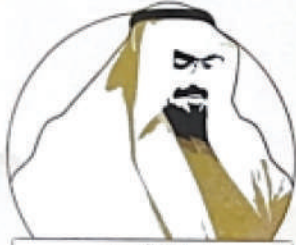
مسابقة الدكتور عبدالرحمن العبدالله المشيقح الأدبية