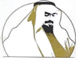
مسابقة الدكتور عبدالرحمن عبداللّه المشيقح الأدبية