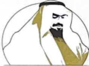
مسابقة الدكتور عبدالرحمن عبداللّه المشيقح الأدبية