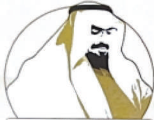
مسانقة الدكتور عبدالرحمن العبدالله المشيقح الأدبية