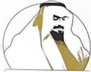
مسابقة الدكتور عبدالرحمن العبدالله المشيقح الأدبية