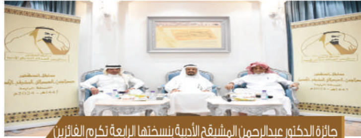
جائزة الدكتور عبدالرحمن المشيخ الأدبية بنسختها الرابعة تكرم الفائزين بفروعها الأربعة ( صور )